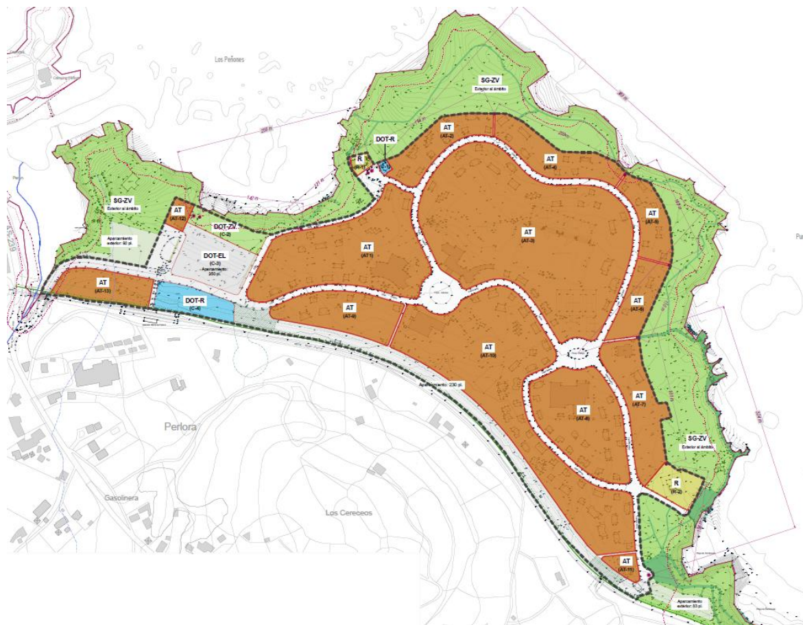
Figura 3: Fragmento del Plano de Ordenación P0-1 en el que se representa la zonificación de usos. Así, en este marco de pragmatismo, la memoria justificativa comienza por la asignación de usos. A partir de su emplazamiento y las características de la Ciudad Residencial se afirma que “el uso más adecuado, a priori, sea el de alojamiento turístico para el que fue concebida en origen”. A esta aseercción se añade que “el monocultivo turístico podría generar problemas de estacionalización” con lo que se propone un régimen de usos compatibles relacionados con las actividades económicas propias del sector terciario como oficinas, hostelería o comercio con

informativa se describe que estas cuestiones han de completarse “no obstante, con un enfoque pragmático a propósito de los usos susceptibles de implantación y de la viabilidad en el tiempo de las actuaciones”. De lo que se deduce que el PEPRi intentar encontrar un difícil equilibrio entra la búsqueda de la preservación de los valores intrínsecos con la viabilidad económica y pragmática de la implantación de nuevos usos.