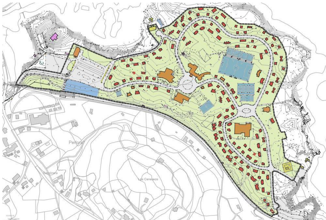
Figura 1: Extracto del plano de información 6.2. Análisis. Usos

En la sede electrónica del Principado de Asturias, a través del enlace: https://medioambiente.asturias.es/inicio en el apartado de Participación Ciudadana > Consultas e información pública de trámites ambientales > Procesos con trámite de participación ambiental abierto > Evaluación ambiental de planes y programas, se ha podido acceder a la documentación del plan 4 .