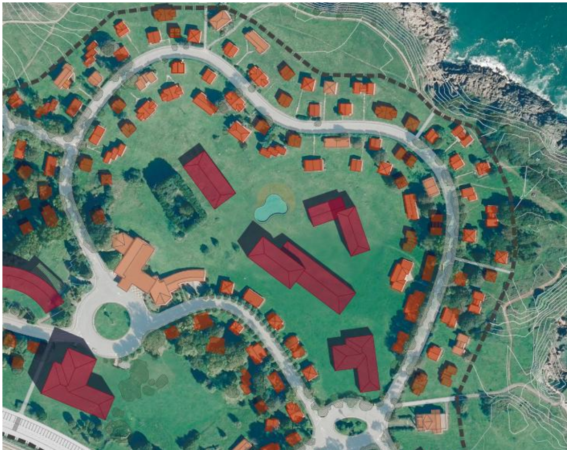
Figura 4: Fragmento del plano de ordenación PO-2 con la ordenación propuesta para el espacio que actualmente ocupan las instalaciones deportivas y en el que se señalan nuevas edificaciones.

el propósito de que el complejo tenga actividad todo el año. Sin embargo, se obvia toda mención a usos recreativos y deportivos lo que pone en riesgo la presencia de las instalaciones deportivas que históricamente han ido ocupando un espacio central dentro del sistema de espacios libres. Si se observan los planos de ordenación PO-1 de zonificación y PO-2 de ordenación se observa cómo no se contempla la presencia de estos usos, lo que dificulta la prestación de servicios vinculados al turismo social o deportivo y la prestación de estos servicios a la propia comunidad local. Además, aunque en el PO-2 de ordenación consta en el cajetín que se trata de una imagen no vinculante, se representa a modo de “pastillas” orientativas una serie de edificaciones de obra nueva en el espacio que actualmente ocupan las instalaciones del Club Victoria de Perlorá y las pistas de tenis. Los usos deportivos solo son tomados en consideración en la denominada Alternativa 0, que de facto supone la no actuación en el ámbito de Perlorá.