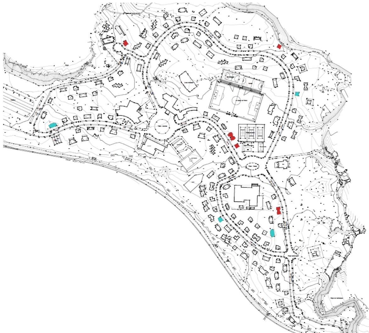
Figura 2: Edificaciones declaradas en estado de ruina.

La memoria informativa es el resultado del análisis territorial y recoge la información necesaria para el planteamiento de los objetivos y determinaciones que justifican la ordenación propuesta. Así, el documento de la memoria informativa se compone de siete capítulos en los que se atiende, entre otras cuestiones, al marco histórico, el marco territorial, la descripción del ámbito y estado actual, las condiciones urbanísticas y la normativa sectorial.